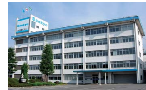
日本電産サンキョー株式会社

同社の出発点は1948年、オルゴール試作1号機の完成にまで遡ります。現在では、マイクロモータ、モータ駆動ユニット、レンズ駆動ユニット、ATM用磁気カードリーダー、液晶ガラス基板搬送用ロボットなど、多彩な製品分野で世界トップクラスのシェアを獲得。同社の国際競争力の根幹にあるもの、それは磁気と光学の技術をベースに、素材開発や精密加工などの独自技術を融合したオンリーワンの技術です。